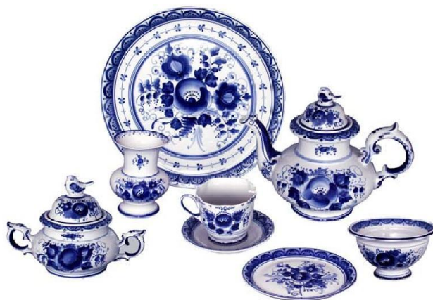
Рисунок 1 – Гжельская роспись